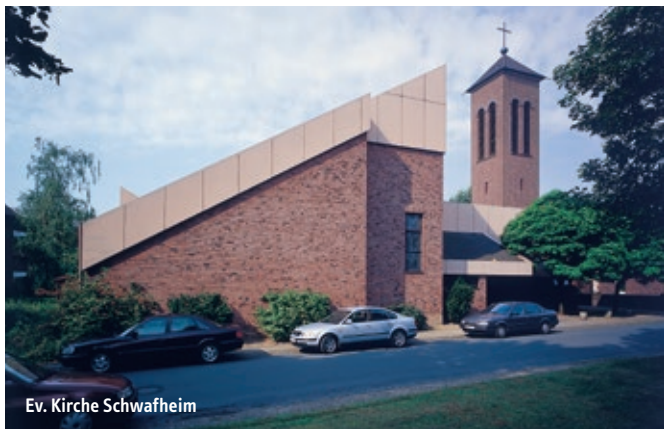
Ev. Kirche Schwafheim

Anmeldung: Gruppen ab vier Personen bitte bei der Alzheimergesellschaft, Tel. 02841 100145